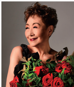
歌手 加藤 登紀子