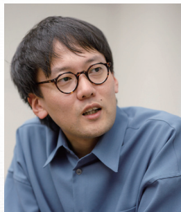
人新世の「資本論」著者 齋藤 幸平氏